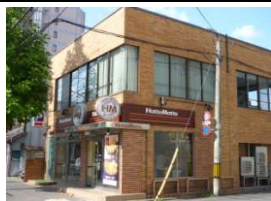
ほっともっと(お弁当) 徒歩5分(390m)