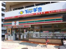
セブンイレブン 徒歩5分(400m)