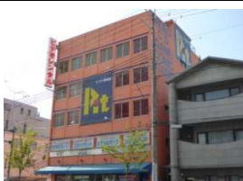
ビット(レンタルビデオ) 徒歩7分(560m)