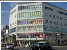
アフレ西院(複合ビル) 徒歩9分(680m)