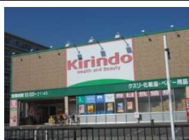
麒麟堂(ドラック) 徒歩5分(380m)