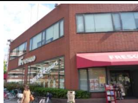
フレスコ(スーパー) 徒歩10分(790m)