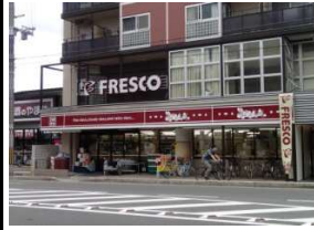
スーパー「フレスコ」 徒歩5分(380m)