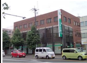
りそな銀行 徒歩4分(280m)