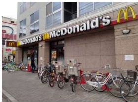
マクドナルド 徒歩8分(580m)