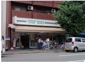
100円ローソン 徒歩5分(330m)