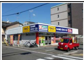
レンタルDVD ゲオ 徒歩4分(310m)