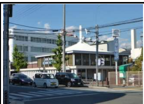
京都中央信用金庫 徒歩6分(650m)