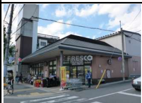
スーパーフレスコ 徒歩6分(440m)