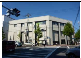
三井住友銀行 徒歩6分(470m)