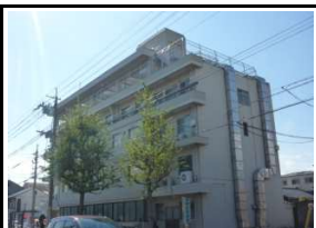
京都北野病院 徒歩6分(420m)