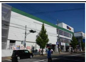
家電のエディオン 徒歩7分(560m)