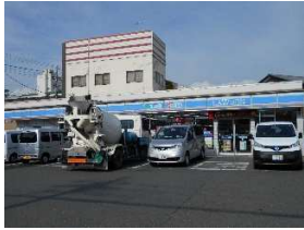
ローソン 徒歩4分(約270m)