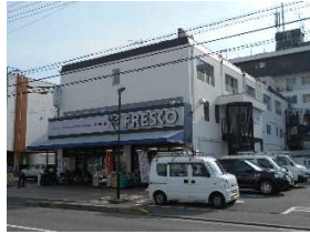
フレスコ 徒歩4分(約300m)