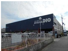
ディオハウス 徒歩5分(約400m)