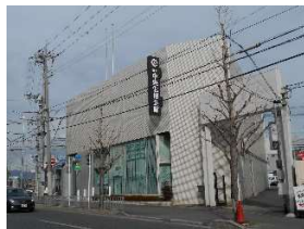
京都中央信用金庫 徒歩8分(約600m)