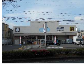
ドラッグストア ダックス 徒歩11分(約850m)