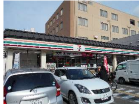
セブンイレブン 徒歩3分(約210m)