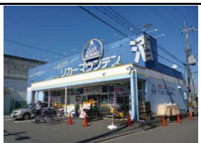
リカーマウンテン 徒歩13分(1000m)