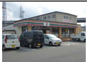
セブンイレブン 徒歩3分(200m)