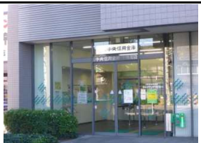
京都中央信用金庫 徒歩9分(650m)