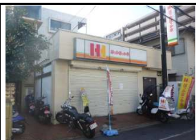
ほっかほっか亭 徒歩8分(520m)