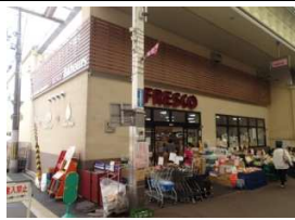
スーパーフレスコ 徒歩2分(140m)