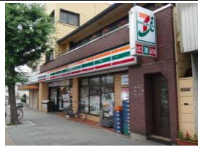
セブンイレブン 歩3分(180m)