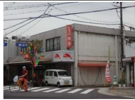
スーパー水谷 歩2分(100m)