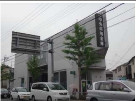
京都中央信用金庫 歩4分(270m)