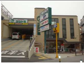
スーパーツジミ 歩2分(140m)